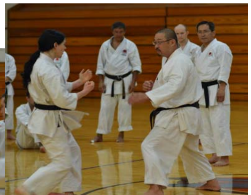
Shiina Sensei enseignant le Kumite